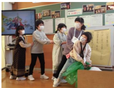
小学部全体で行う活動 図書集会