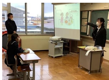
ICT機器を活用した学習指導