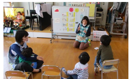
行事や校外学習における言語指導