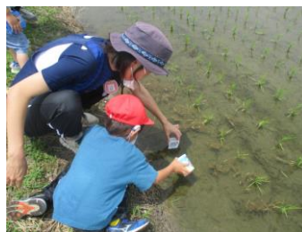
季節の活動 (おたまじゃくし採り)