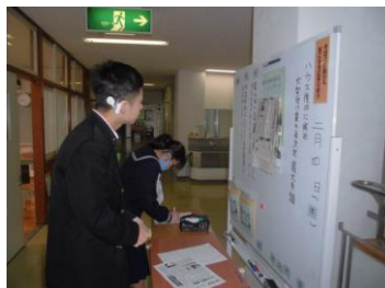
新聞記事についての取組