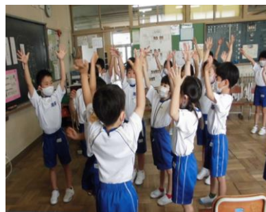
交流及び共同学習 近隣の小学校や富山聴覚総合支援学校と交流学習を行っています。 希望する場合は居住地校交流を行います。