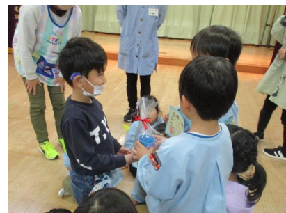
近隣保育園との交流保育