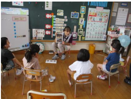
朝の会におけるカレンダーワーク