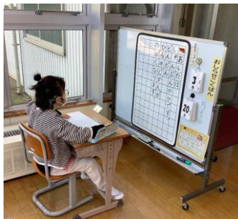
お知らせ黒板を活用した 言語指導