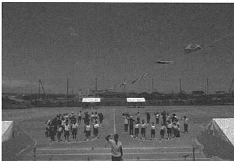
創立60周年記念運動会